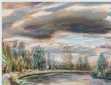
Oude Rijn bij Woerden, richting Nieuwerbrug en Waarder, 1939

Daaronder zitten ook de meeste werken die nu in de Gestelkamer te zien zijn.