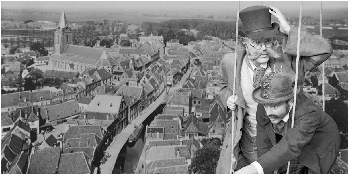
Kleinkunstduo 'Haar Wereldreizigers' die een stuk maakten op basis van het Verhaal van Woerden, 2016.

Diverse grote en kleine samenwerkingsprojecten met andere Woerdense instellingen zullen de komende jaren gestalte krijgen. In 2016 wordt samen met Nachtcultuur de projectiemogelijkheid op de zijmuur van het Stedsmuseum gebruikt om de succesvolle 'Woerdense' film Natuur in de Delta te vertonen. In 2016 worden de podiumkunsten ingezet om jeugd kennis te laten nemen van de eigen geschiedenis maar ook om ze te enthousiasmeren voor de podiumkunsten. Het Linschotense Kleinkunstduo Haar Wereldreizigers ontwikkelde een verteltheater dat zich afspeelt in het Woerden aan het einde van de 19 e eeuw. Het stuk waarin typisch Woerdense ingrediënten voorkomen als pannembakkerijen, kaasproductie, het ontstaan van het treinstation maar ook problematiek als kinderarbeid en het kindernetje van Van Houten kan zowel (groot-)ouders als kinderen prikkelen. Het is ook niet ondenkbaar dat andere podiumkunsten, dans, muziek, dichtkunst gestalte krijgen in samenwerking met het Stedsmuseum.