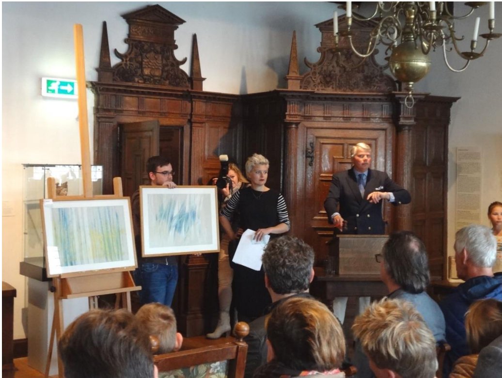
Veiling BKR-werken 2015

Het Stedsmuseum organiseert speciale rondleidingen voor Alzheimerpatiënten en hun verzorgers, hield een Veiling van BKR-werken (geheel volgens de regels van LAMO) en organiseerde een Openluchtfilmavond waarbij de film op de zijgevel van het museum werd geprojecteerd. Publieksactiviteiten als deze blijven op de agenda staan en worden bij voorkeur nog meer toegespitst op de in dit beleid verwoorde doelen. Zo wordt er binnenkort een start gemaakt met een grootouders-kindermiddagen waarbij verhalen worden verteld die géént zijn op historische feiten uit het Verhaal van Woerden. De in 2015 voor het eerst gehouden 'Filmavond in de open lucht' krijgt in 2016 vervolg en wordt een jaarlijks terugkerende activiteit. Mooie laagdrempelige en publieksvriendelijke activiteit waarbij samengewerkt wordt met omliggende horeca.