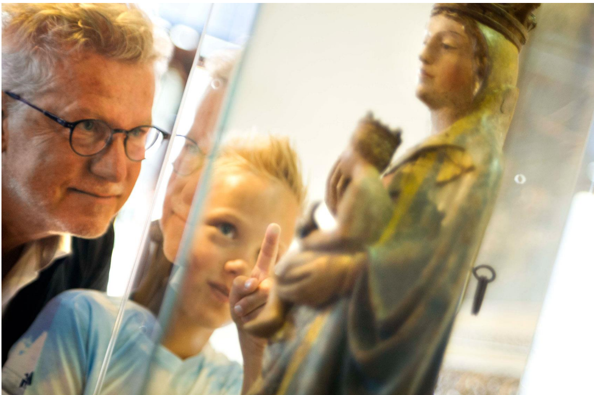
Vrienden van het museum bij 15 e -eeuwse Maria in de Vroedschapszaal

De Vriendengroep van met name beeldende-kunstliefhebbers bestaat over het algemeen uit oudere inwoners van Woerden (50 – 80 jaar), gemiddeld wat hoger opgeleid en beter gesitueerd. Een groep die het belangrijk vindt dat in een kleine stad als Woerden Kunst en Cultuur onderdeel uitmaken van de samenleving. Binnen deze groep is een kleine kring die zich zeer actief opstelt en altijd aanwezig is bij openingen en activiteiten. De Vrienden ondersteunen het museum bij bepaalde projecten ook financieel. Ook initiëren zijn zelf projecten, brengen een eigen nieuwsbrief uit en organiseren bijeenkomsten voor de Vrienden in het museum. De vrienden concentreren zich vrijwel alleen op het Stadsmuseum als exposant van beeldende kunst.