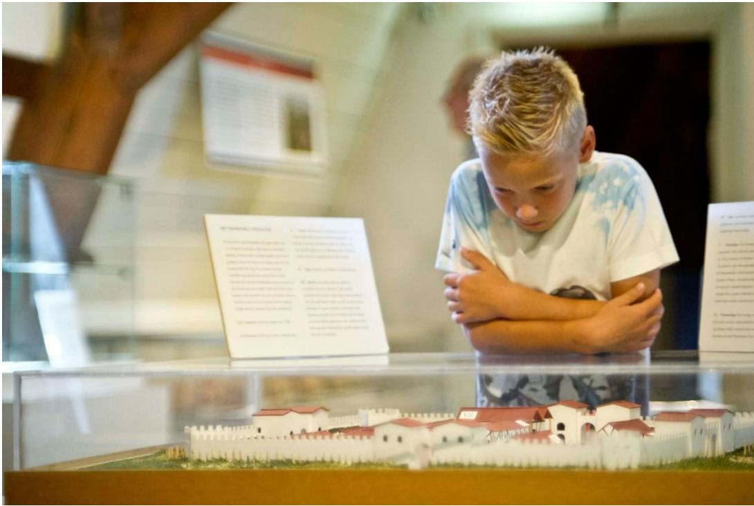
Jonge bezoeker op 'de Romeinse zolder' gebogen over een model van een Romeins Castellum

voor cultuurliefhebbers van buiten, veel Woerdenaren, kinderen, maar ook jeugd, jongvolwassenen en gezinnen is het 'hapje' Stadsmuseum nog niet lekker genoeg.