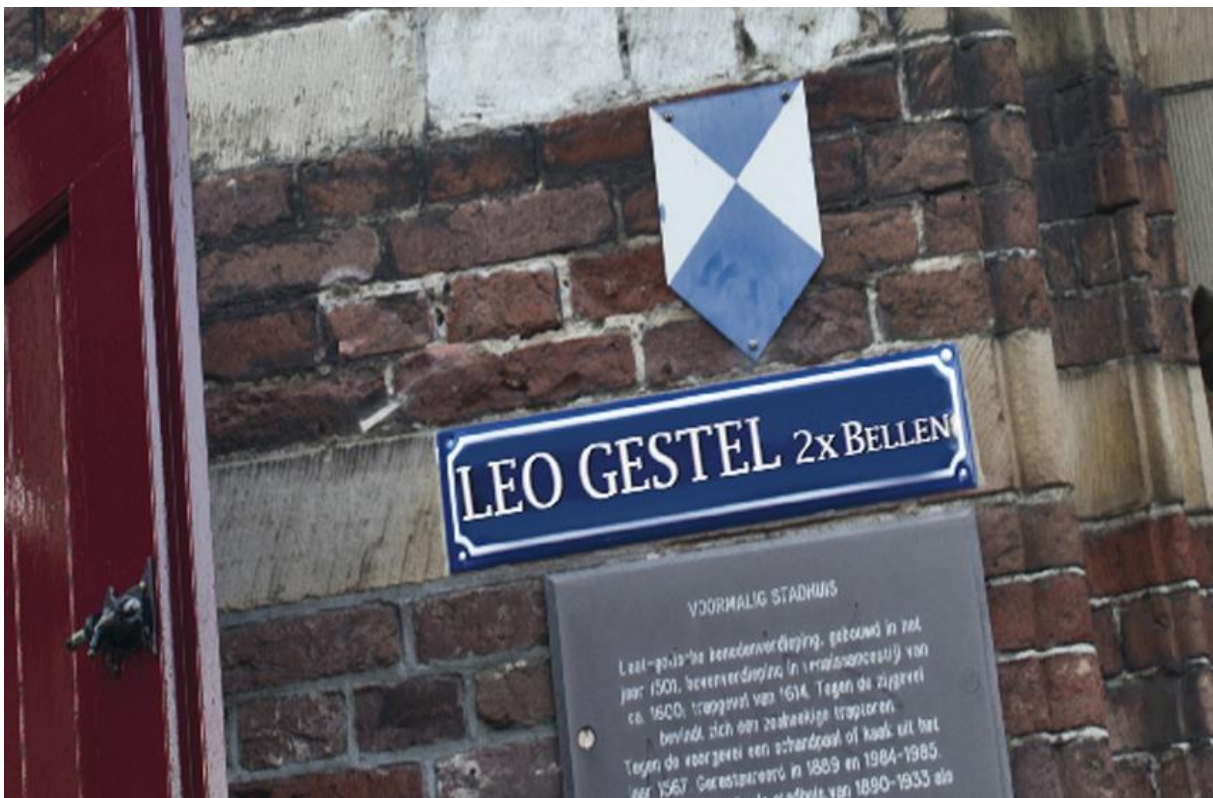
Leo Gestel als prestigieuze en inspirerende focus voor Stadsmuseum, Woerdenaren en jeugd.

Dus, de Kerntaak van het stadsmuseum is om díe activiteiten te ontwikkelen op het gebied van cultuurhistorie en beeldende kunst waarvan bezoekers leren, genieten, waarover men zich verbaast en waarmee men zich verrijkt voelt. Om Woerdenaren een stap te laten nemen, om ze daadwerkelijk te motiveren om deel te nemen aan deze activiteiten/ evenementen is het belangrijk dat e.e.a. uniek, aantrekkelijk, prikkelend en waardevol gepresenteerd wordt.