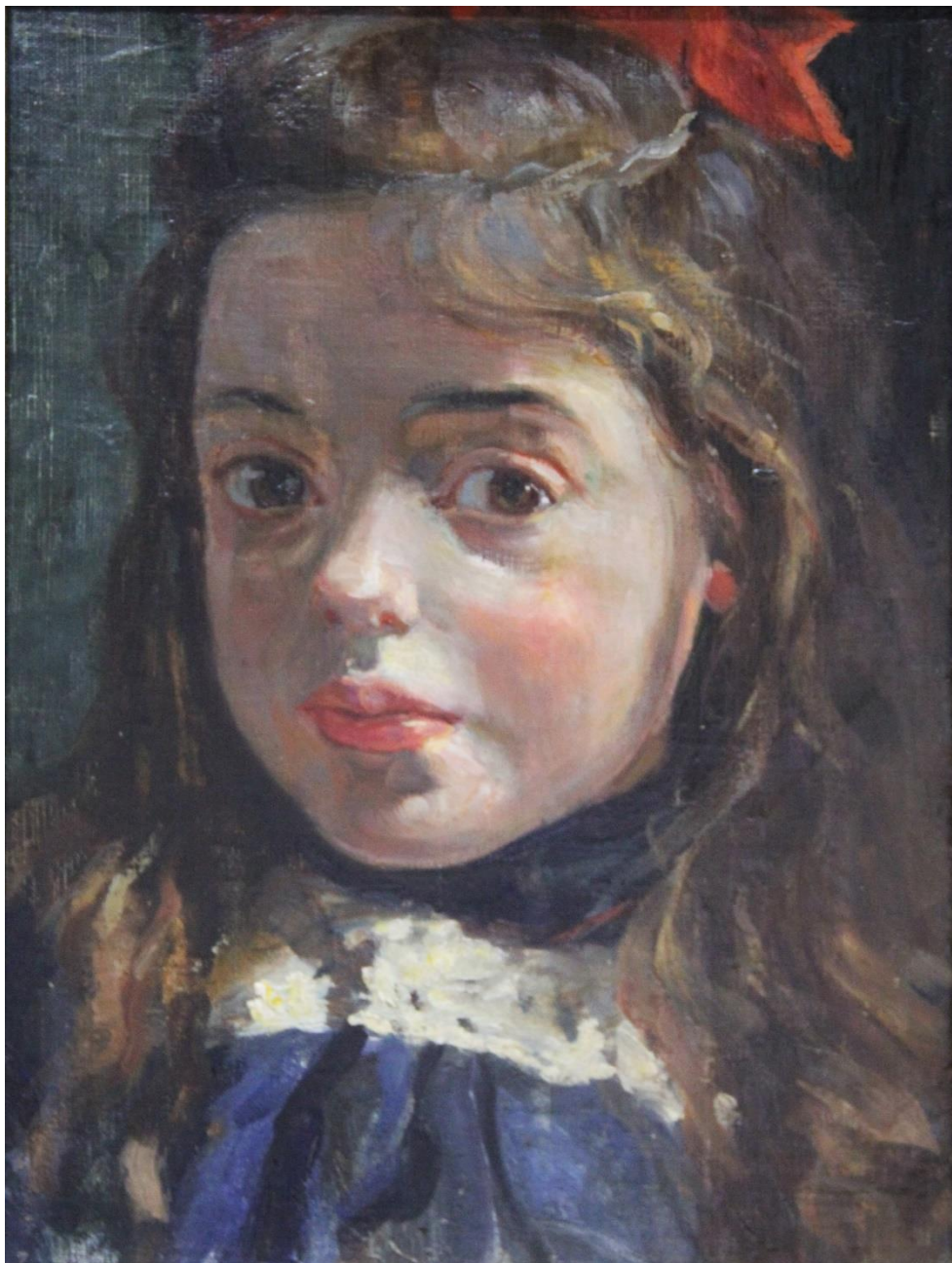
Leo Gestel (1881 – 1946), Emmetje